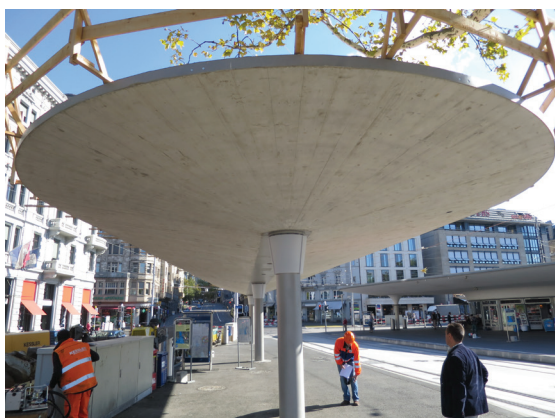
Bild oben: Schalung von unten / Bild unten: ausgeschaltete Untersicht