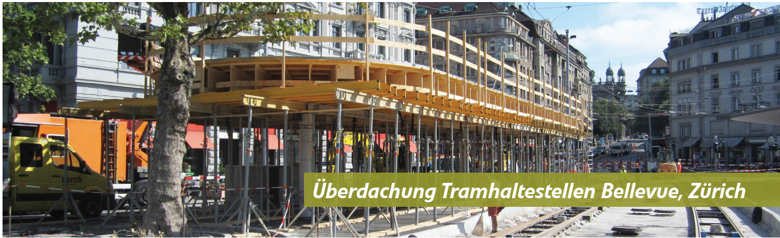
Überdachung Tramhaltestellen Bellevue, Zürich